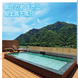
鰻匠の家 すぎ山 屋上露天風呂

気軽に立ち寄れて ほっと一息、 日帰り温泉を のんびり楽しめたい ●岐阜グランドホテル ●ホテルパーク ●鰻匠の家 すぎ山 ●石金 十八楼 ※裏面に詳細あり