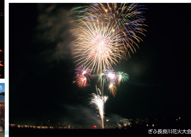
ぎふ長良川花火大会